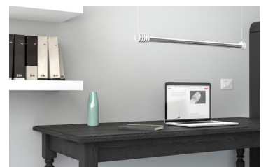
Wie alle Leuchten von HOLY TRINITY ermöglicht KALA individuelle Gestaltung durch intuitive Bedienung.