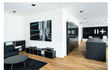
Die HOLY TRINITY Leuchten integrieren sich harmonisch in jedes Wohn- und Officeambiente.