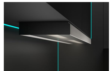
Unterbauleuchte AREA von HOLY TRINITY