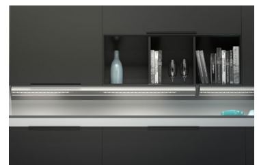
Optisch fast unsichtbar setzt AREA beeindruckende Lichtakzente.