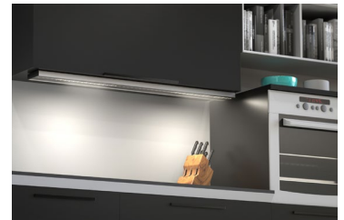
AREA integriert sich nahezu unsichtbar in jedes Wohnambiente.