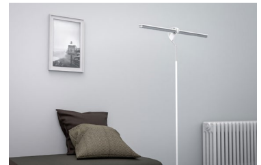
ORON füllt sowohl den Wohn- als auch den Arbeitsraum mit stiller Eleganz.