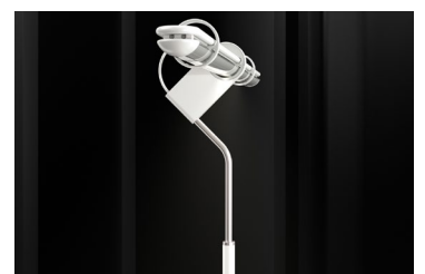
Mit einer simplen Handbewegung lässt sich ORON um bis zu 60 Grad schwenken.