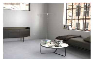
ORON fügt sich harmonisch in jedes Ambiente ein.